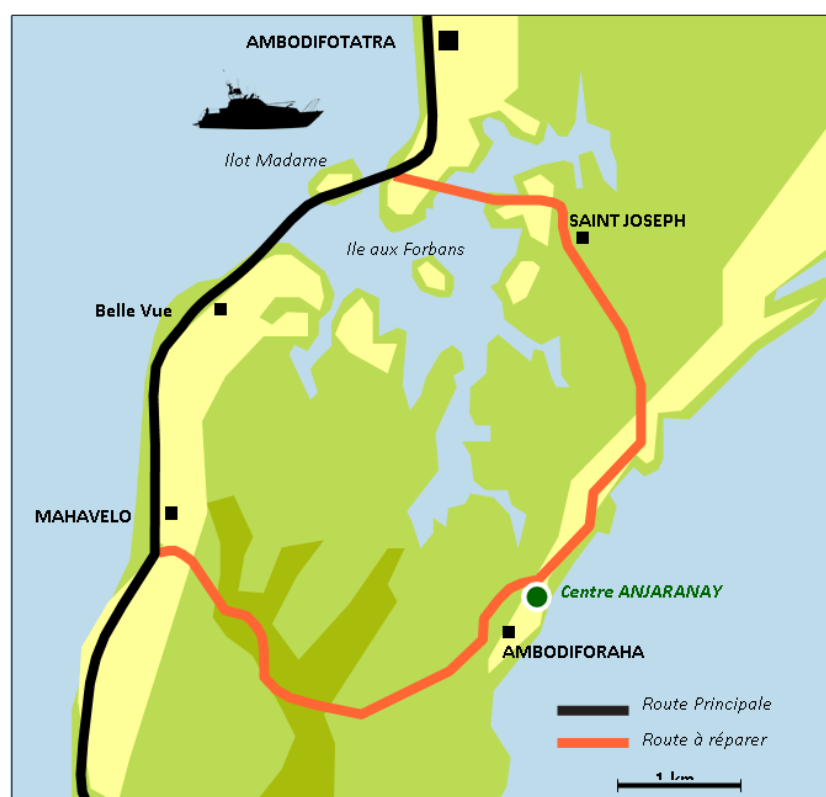
La boucle Est